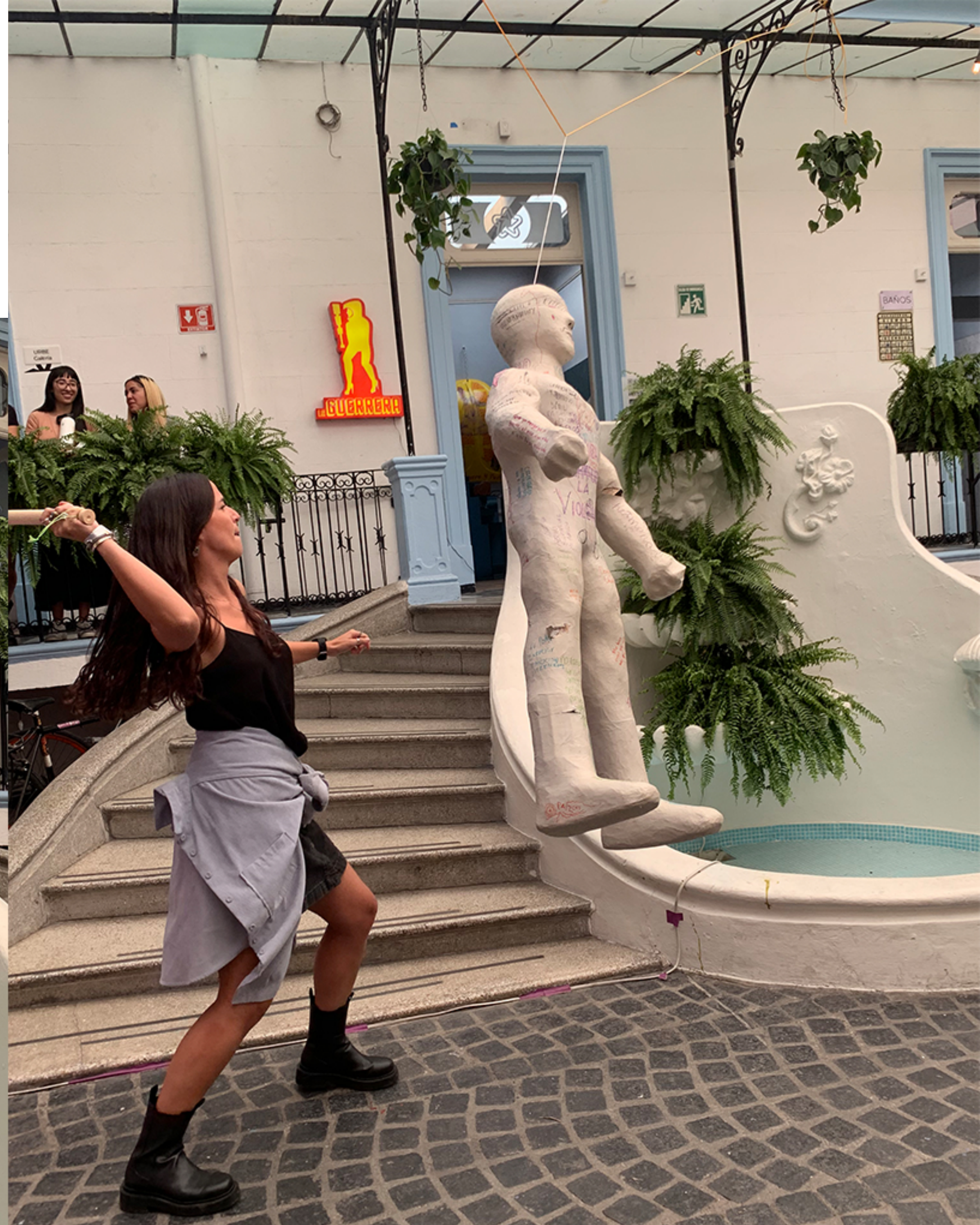
PERFORMANCE PARTICIPATIVO EN CLAVO 4, CDMX. 2022